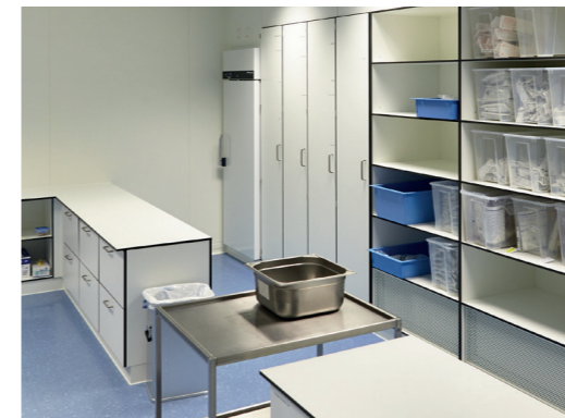
Clean room furniture