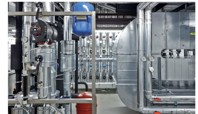
Technical plant room