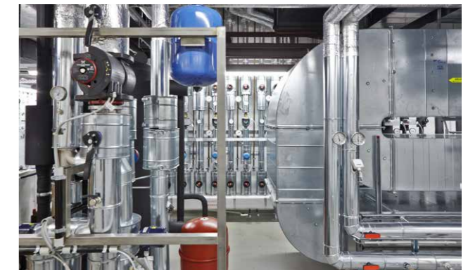
Technical plant room